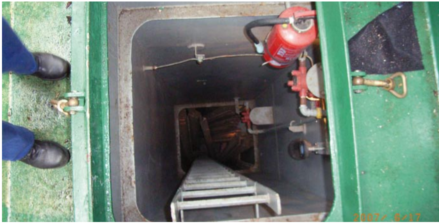
Det trapphus där två personer dog då fartyget låg till kaj i Timrå i maj 2007.