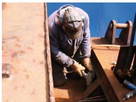
Personnel descaling rust need to take regular breaks to rest their bodies.

Training: Exercise and muscle training strengthens your body and means that you can cope with larger strains at work and in your spare time. The most important muscle groups to train are the stomach muscles (for an upright