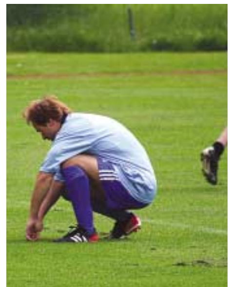
Tung förlust för "Silja Symphonys" besättning.