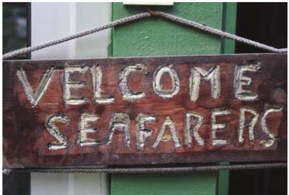
På Kaknäsklubben försöker man tillgodose allas önskemål.

anspråkslös ut, men baksidan har desto mer. Här finns en stenlagd uteplats med motionscyklar och en rejält tilltagen murad grill. Ute på gräset glittrar en rund swimmingpool och en bit längre ner breder två välklippta fotbollsplaner ut sig. Fotbollen har en central plats på Kaknäsklubben och förra säsongen spelades 76 matcher. Men idrottsmötena handlar om betydligt mer än bara fotboll, säger Peter.