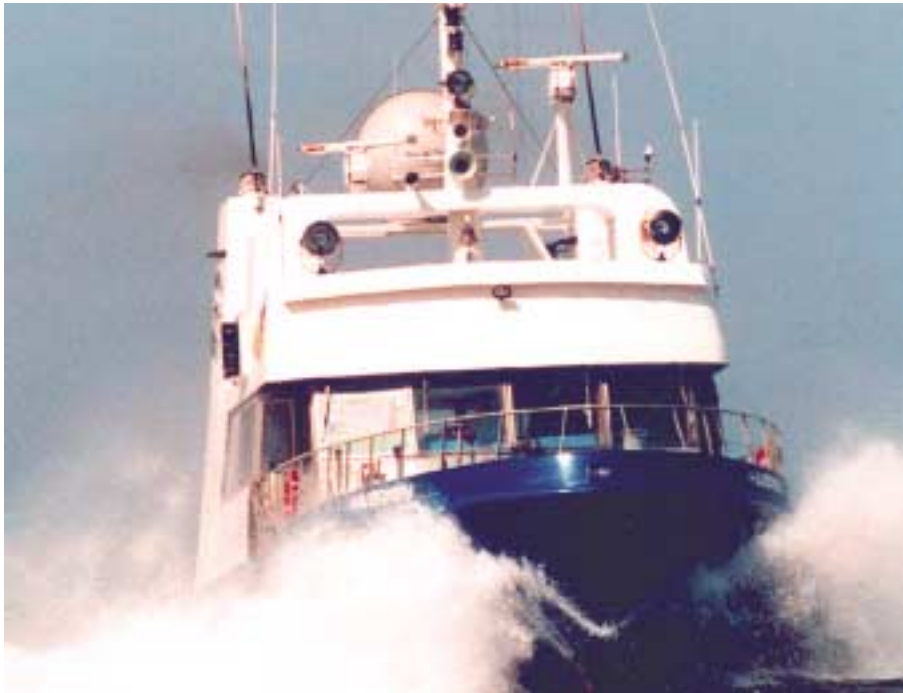
Modern sjöfart kräver skärpt besättning.