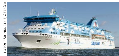
Silja Galaxy.

– Vi har exempelvis en lokalvårdare som brinner för det här med kemikalier och farliga ämnen, och hon har varit runt på alla avdelningar och pratat om detta. Jag brukar uppmuntra skyddsombuden