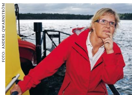
Infrastrukturminister Åsa Torstensson.

I den kommande forskningsrapporten finns många problem och lösningar redo-