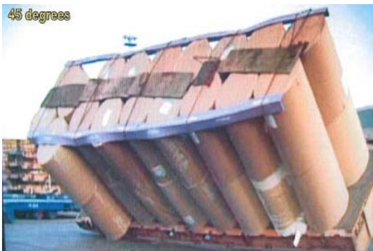
Vid ett lutningsprov som utfördes av Finnlines 2007 gled lasten av rolltrailern vid en lutning på cirka 45 grader. Bild ur Haverikommissionens rapport.