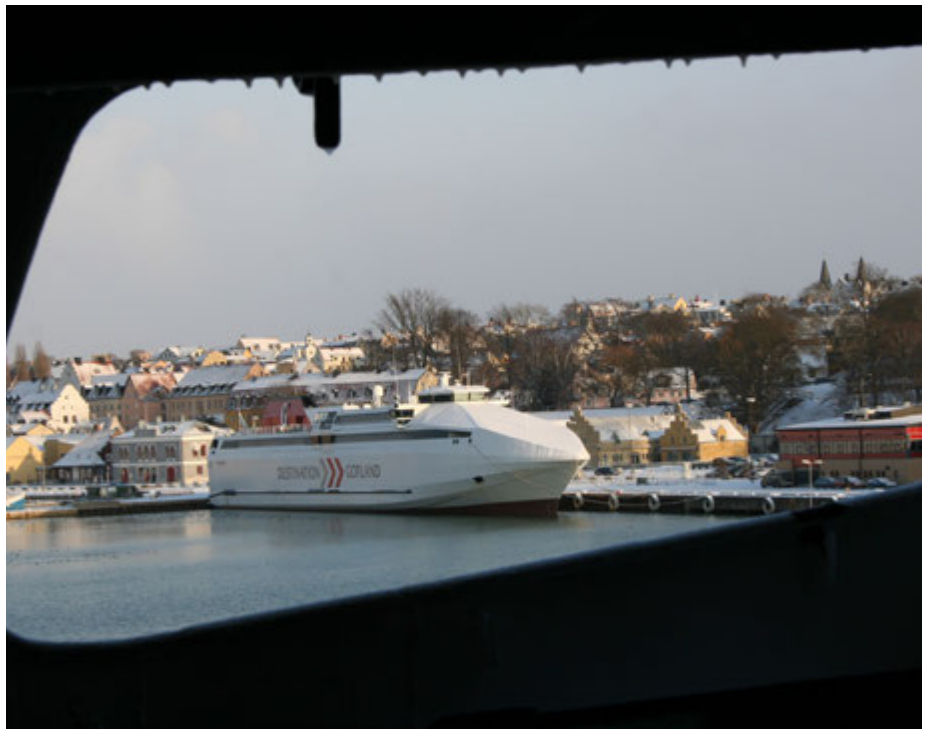
Ankomst i Visby.

På M/S Gotland finns tre ordinarie skyddsombud och en vice från varje avdelning: däck, maskin och ombordservice. Därutöver har man ett huvudskyddsombud som samordnar arbetet. Ungefär var tredje månad hålls ett skyddskommittémöte och många av de större förändringar som genomförts har drivits igenom via skyddskommittén. Som det nya omklädningsrummet, ändringar i byssan där vassa hörn tagits bort och arbetsbänkar justerats, inrättandet av ett ombordgym och nu senast, dragningar av nätanslutningskablarna in till hytterna. Det sistnämnda var verkligen välbehövligt, säger Dennis.