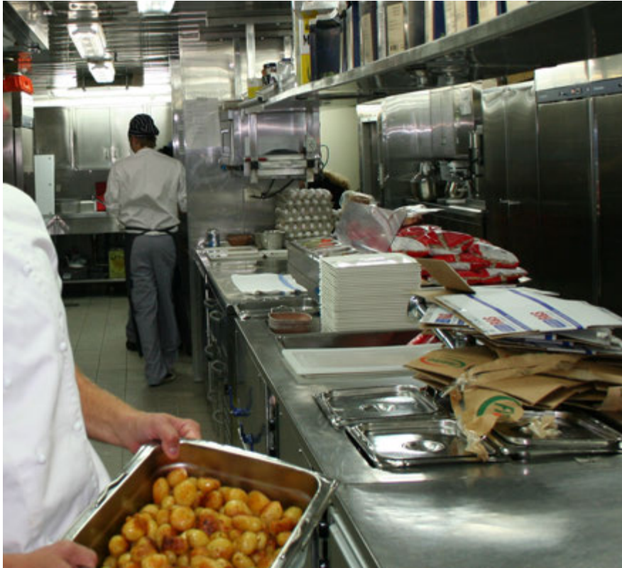
Ökad lungcancerrisk hos kökspersonal beror på rökning.

Kockar och annan kökspersonal löper större risk än andra att drabbas av lungcancer. Men det beror inte på dålig luft i restaurangköken utan på rökning. Det visar studier vid Karolinska Institutet.