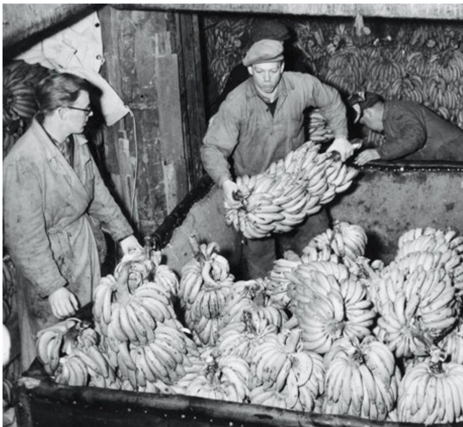
Tuffa villkor på de gamla bananbåtarna.

I slutet av 1940-talet förnyades arbetarskyddslagen. Det blev obligatoriskt att utse ombud på arbetsplatser med minst fem anställda liksom att inrätta skyddskommittéer på företag med minst 50 anställda. Det blev även möjligt att utse regionala skyddsombud med uppgift att hantera arbetsmiljöfrågor på mindre arbetsplatser som saknade egna ombud. Men samtidigt fanns ett groende missnöje över ombudens begränsade handlingsförmåga. Många menade att de inte hade tillräckligt inflytande och styrdes för mycket av arbetsgivarna.