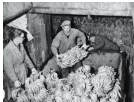
Hard conditions on the old banana ships.