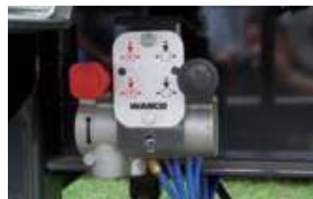
Brysselventilen är den röda. Instruktionerna är tydliga och lätta att förstå.