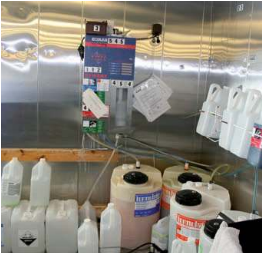
Rengöringsprodukter för köket blandas med hjälp av en doseringsapparat.

Själv har han stor respekt för kemikalier, inte minst sedan han drabbades av en frätskada för många år sedan.