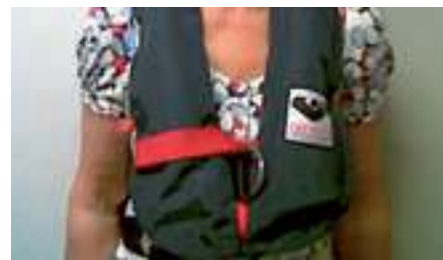
Uppblåsbara flytvästar som inte blåser upp